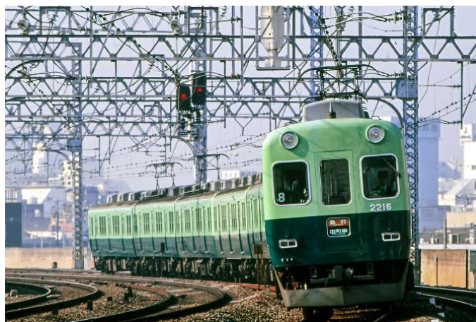
リバイバル塗装(8両編成時代のもの)